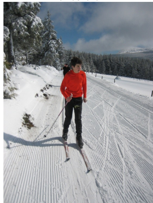
ski de fond