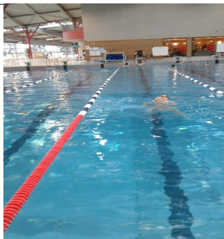
Natation en durée